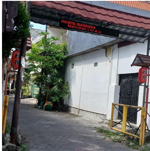
Gambar 1. Gapura serta ornamen tematik di Kampung Jepang