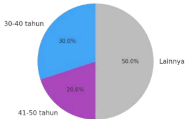
Gambar 3. Persentase Distribusi Usia Pengurus Aktif Kampung Jepang