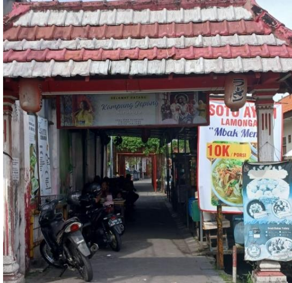
Gambar 3. Kawasan kuliner UMKM RT 05