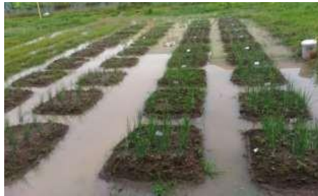
Gambar 2. Kondisi Banjir di Lahan Penelitian

Kondisi cuaca yang sangat ekstrim di waktu penelitian 5 sampai 8 MST menyebabkan kondisi lahan penelitian mengalami banjir, hal ini mengakibatkan meningkatnya serangan penyakit bercak ungu dan penyakit trotol dimana kerusakan yang ditimbulkan sampai 100% dalam waktu singkat sehingga tanaman tidak dapat berproduksi maksimal dan memperoleh hasil tidak nyata terhadap pengamatan parameter tanaman di fase generatif. Hal ini sesuai dengan hasil dokumentasi dan data BMKG yang dilampirkan.