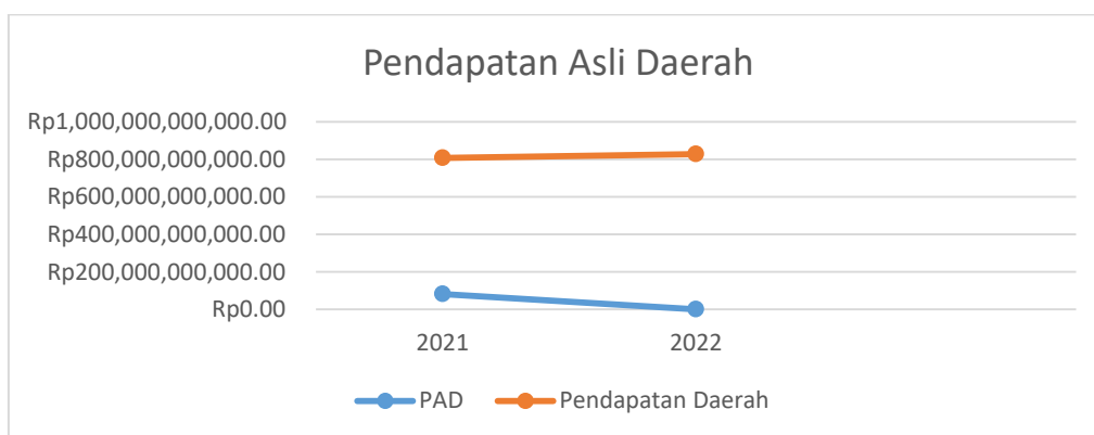
Grafik pendapatan Asli Daerah dan Total P Grafik pendapatan Asli Daerah dan Total Pendapatan daerah Kota Tidore Kepulauan 2021-2022

Sumber: data BPKAD Kota Tidore Kepulauan