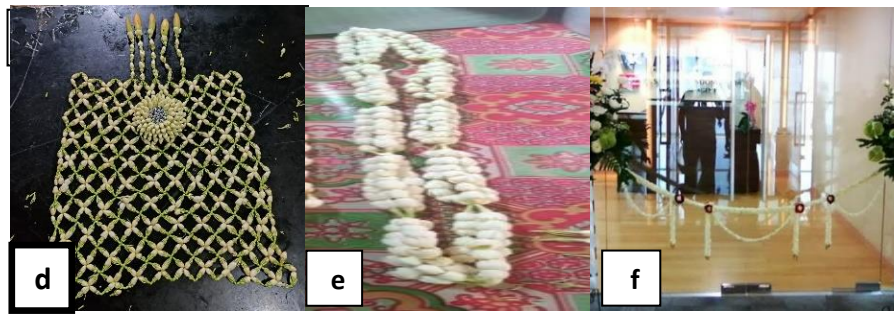
Gambar 3. (a) Kalung pengantin pria (b) Hiasan sanggul pengantin wanita (c) Hiasan kepala pengantin pria (d) Ronce melati untuk baju siraman (e) Hiasan pada keranda atau peti mati (f) Dekorasi dalam acara pemotongan pita (Sumber Gambar: Dokumentasi Pribadi, 2024).