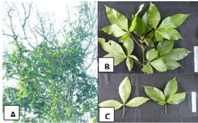
Gambar 1. Vitex pubescens A. Perawakan; B. Susunan daun; C. Bentuk daun

Callicarpa pentandra merupakan pohon dengan jumlah kunjungan burung terbanyak keempat. Dari hasil pengamatan yang dilakukan pada pohon ini diperoleh data kunjungan burung sebanyak 28 kali kunjungan. Jenis-jenis burung yang berkunjung ke pohon ini adalah Aegithina tiphia , dimana jenis ini merupakan jenis yang mendominasi, Pycnonotus brunneus , P. simplex , P. erythrophthalmos , P. goiavier , Oriolus xanthonotus dan Passer montanus .