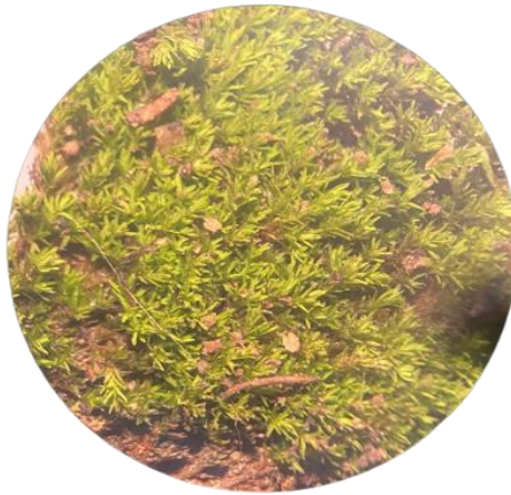
Gambar 4. Trichostonium brachydontium Brunch.

banyak digunakan biomonitor, karena kelimpahannya dan kapasitas uniknya untuk mengakumulasi racun lingkungan (Capozzi et al. , 2023).