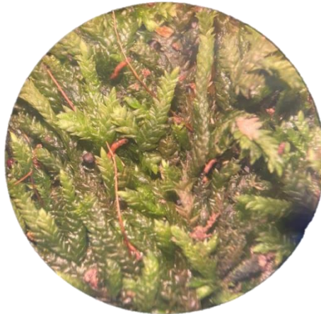
Gambar 3. Hypnum cupressiforme Hedw.

berakhir di bawah puncak. Selain itu, daunnya memiliki gemmae silindris gelap dengan panjang hingga 150 um (Vulević et al. , 2017). Menurut Campisi & Cogoni (2019) dalam Tomović et al. , (2023), spesies Dicranoweisia cirrata tercatat sebagai lumut dengan distribusi sedang di Eropa, di mana umumnya tersebar luas. Populasi Eropa secara keseluruhan diperkirakan stabil. Spesies ini dapat ditemukan di habitat alami dan buatan manusia, sebagai pionir lumut yang mengkolonisasi batang pohon, kayu yang baru membusuk, pagar kayu dan berbagai substrat organik lainnya seperti bebatuan terbuka dan juga dinding batu tua di daerah pegunungan di ketinggian 1500 m. Selain itu, lumut Dicranoweisia cirrata dapat dijumpai pada suatu lokasi terbuka, taman, dan jalan raya dalam kondisi teduh (Meier et al. , 2021). Spesies ini dianggap toleran terhadap polusi udara dan dapat mentolerir hujan asam sampai batas tertentu (Tomović et al. , 2023).