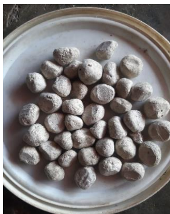
Gambar 3. Kuning

Kuning/param merupakan salah satu ramuan Karo yang sangat populer dimasyarakat yang beretnis Karo. Kuning dibuat dari campuran beberapa tanaman yang sudah digiling atau halus, kemudian dibentuk menjadi ukuran tertentu (bulatan kecil) dan dijemur di bawah sinar matahari sampai kering.