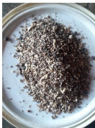
Gambar 4. Sembur

Sembur merupakan pengobatan karo yang bermanfaat untuk mengobati sakit perut, sakit kepala dan melancarkan saluran pencernaan.