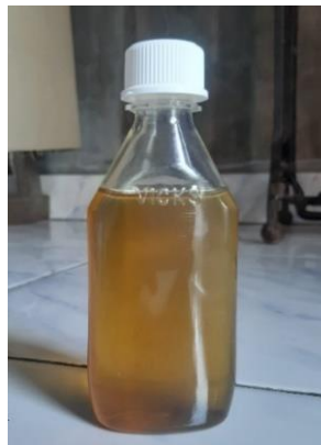
Gambar 5. Minyak Karo

Minyak Karo merupakan salah satu obat yang cukup populer bukan hanya dikalangan masyarakat Karo saja masyarakat dari suku lain juga banyak memakai minyak Karo sebagai pengobatan. Manfaat dari penggunaan minyak Karo yaitu untuk mengobati luka, masuk angin, menghilangkan pegal-pegal dan mengobati masuk angin.