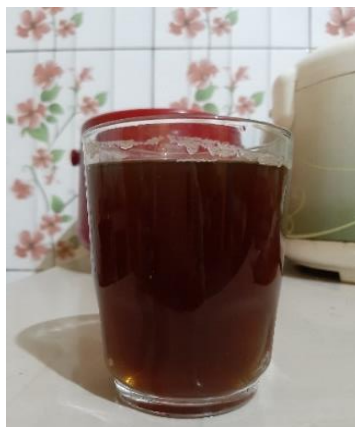
Gambar 8. Bandrek

Bandrek merupakan salah satu minuman yang berkhasiat untuk menghangatkan tubuh dan membuat tubuh menjadi segar.