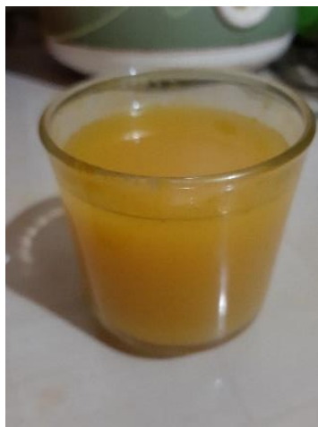
Gambar 2. Jamu Pahit

Salah satu ramuan atau minuman yang sangat berkhasiat bagi Kesehatan adalah jamu. Masyarakat etnis Karo di Kecamatan Sei Bingai memanfaatkan jamu pahit sebagai obat masuk angin dan untuk menghangatkan tubuh. Pembuatan jamu sangat sederhana yaitu dengan menghaluskan semua bahan segar sampai, kemudian disaring dan diambil airnya dimasak sampai matang dan dapat dikonsumsi.