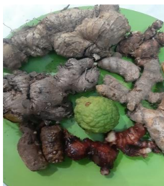
Gambar 7. Bahan Oukup

Oukup adalah salah satu pengobatan tradisional seperti sauna atau mandi uap. Manfaat oukup yaitu untuk mengeluarkan racun melalui keringat sekaligus pembersih kulit.