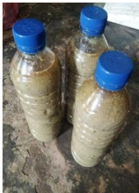
Gambar 6. Tawar Karo

Tawar merupakan salah satu ramuan karo yang memiliki manfaat untuk mengobati masuk angin, sakit perut dan untuk melancarkan peredaran darah.